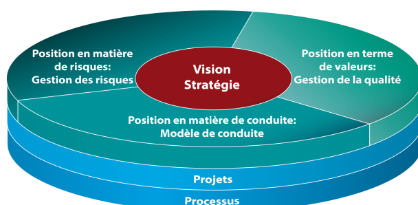
Illustration: modèle d'entreprise orienté objectif selon MAK®

pour le développement continu de votre entreprise. Le fondement de votre entreprise est illustré par le niveau processus, car c'est à travers vos processus productifs que vous assurez votre valeur ajoutée.